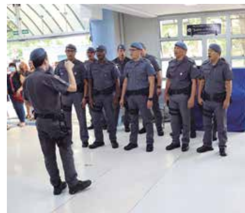
Coral da Polícia Militar

Todas as ações mencionadas fazem parte do Programa Gestão Humanizada - Cuidar de Quem Cuida - no qual a CAV está vinculada, assim como o Programa Vida Saudável.