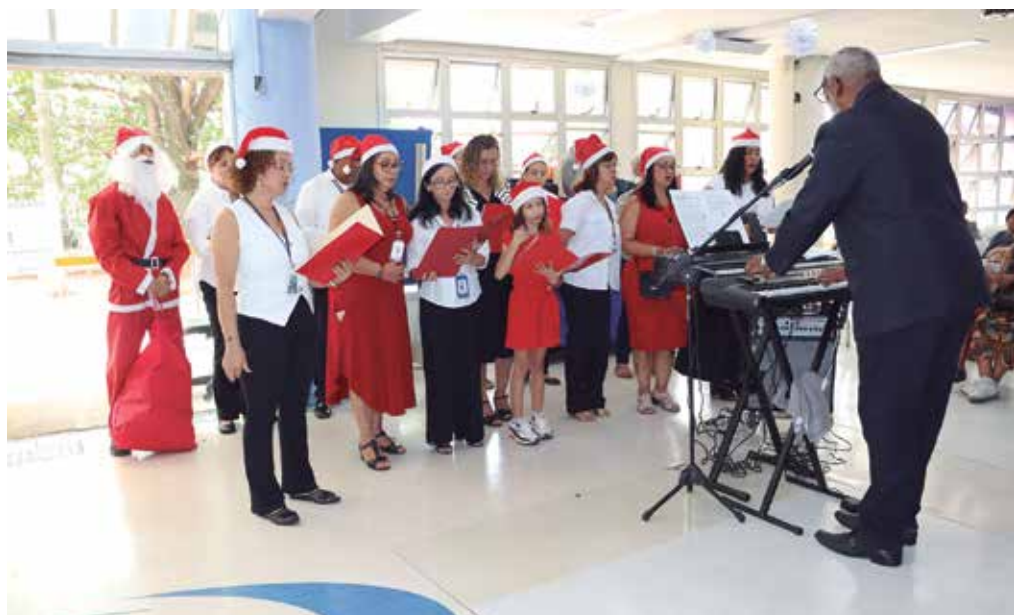
Coral dos Funcionários do HSPM