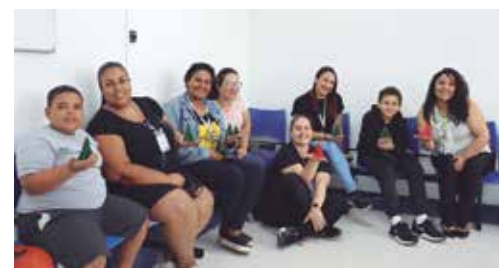
Oficina de origami