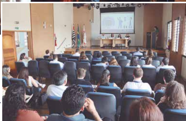
Mesa de Abertura

classificados em 1º, 2º e 3º lugares nas seguintes especialidades: Clínica Médica, Especialidades Clínicas, Especialidades Cirúrgicas, Ortopedia, Traumatologia e Cirurgia da Mão, Ginecologia e Obstetrícia, Pediatria e Cirurgia Geral.