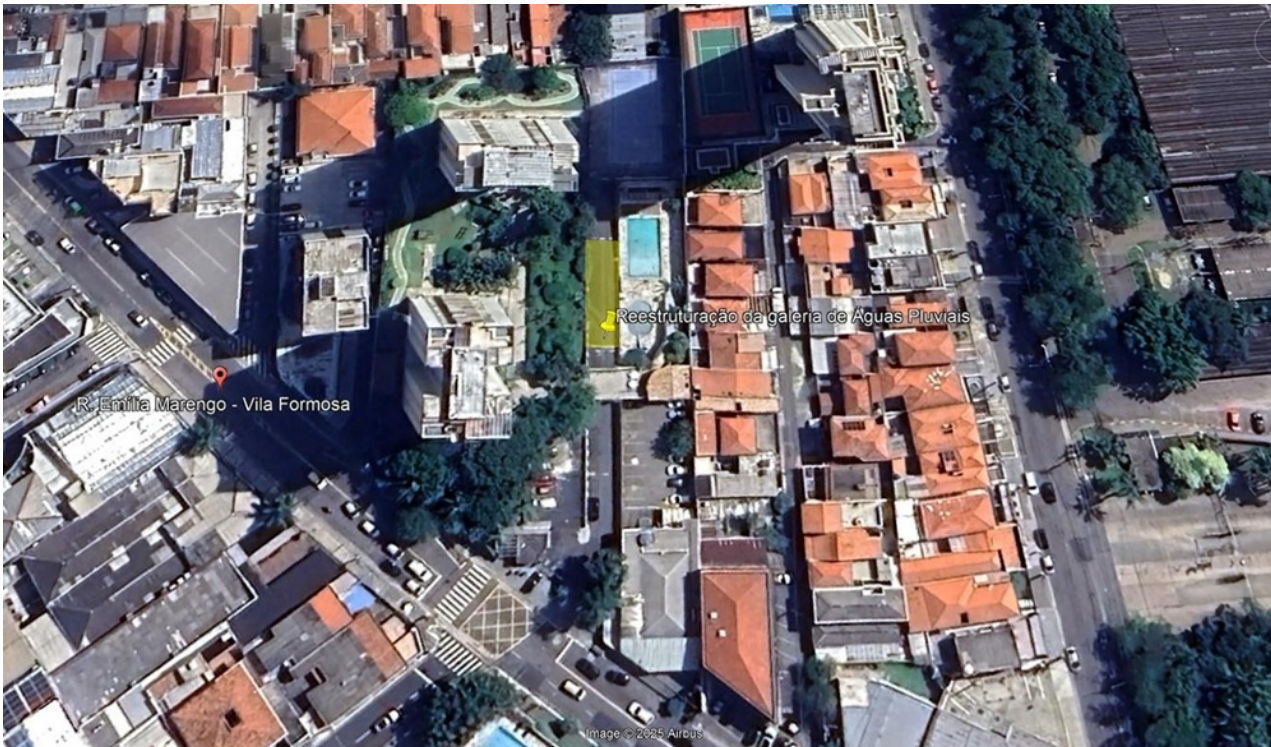
Figura 1 – Rua Emília Marengo, Nº 801.

O presente documento define as especificações para a contratação de serviços técnicos especializados, de modo a assegurar que todas as fases do projeto sejam conduzidas conforme os padrões técnicos e regulatórios estabelecidos em normas vigentes. A empresa contratada deverá executar a obra em total conformidade com as normas vigentes, garantindo a adequação da infraestrutura e a segurança da população.